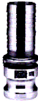
TYPE : E