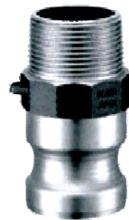
TYPE : F