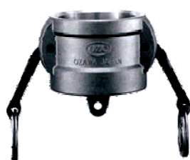
TYPE : DC