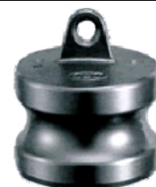
TYPE : DP